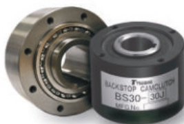
CONTRA-RECUOS E EMBREAGENS DE GIRO LIVRE