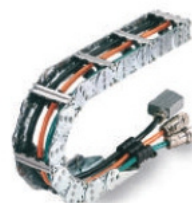
TRANSPORTADORES DE CABO DE AÇO