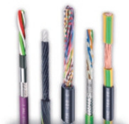
CABOS FLEXÍVEIS CONTÍNUOS