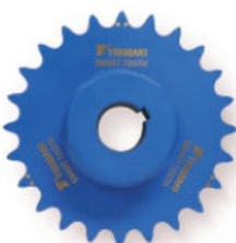
RODAS DENTADAS SMART TOOTH®