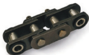
OPÇÕES DE CORRENTE DE ARTICULAÇÃO VEDADA