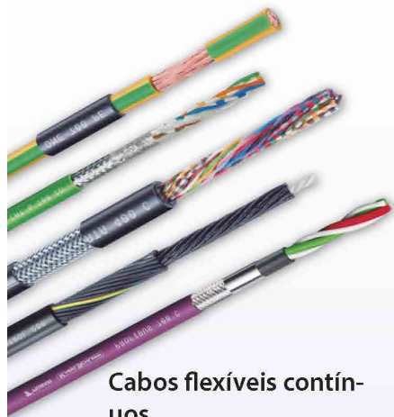
Cabos flexíveis contínuos