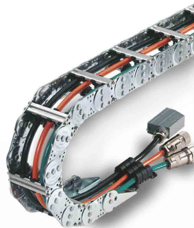
Transportadores de cabo de aço