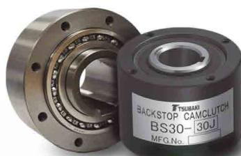
Contra-recuos e embreagens de giro livre