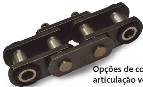
Opções de corrente de articulação vedada