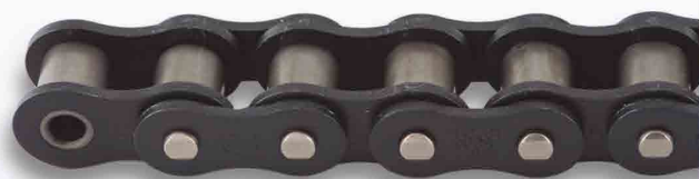
Corrente Lambda® autolubrificante