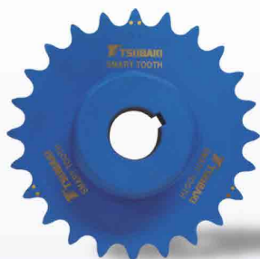
Rodas dentadas SMART TOOTH™